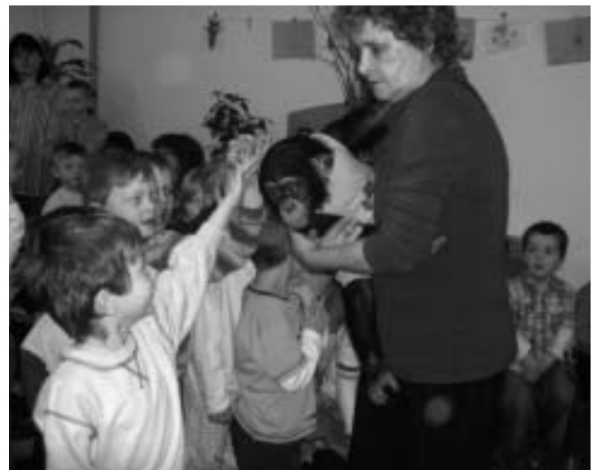
Schimpansen in der Kita

Der Höhepunkt der Ostervorbereitungen war aber eine Schimpansen-Show. Drei der niedlichen Menschenaffen waren in unserer Kita zu Gast. Die Affen turnten uns Kunststücke vor, fuhren Roller und schoben Puppenwagen.