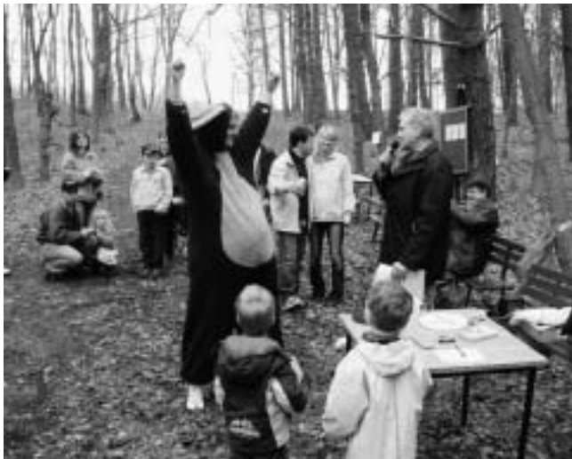
Osterhase wurde Sieger

Wer sich an den Spielen nicht beteiligen wollte oder scheute, den Osterberg hinaufzugehen, der konnte mit anderen Teilnehmern am Fuße des Berges fachsimpeln oder einfach nur einen gemütlichen Plausch führen. Neben reichlich Osterwasser gab es auch Würstchen vom Grill und für die Leckermäuler frisch gebackene Waffeln und Kuchen.