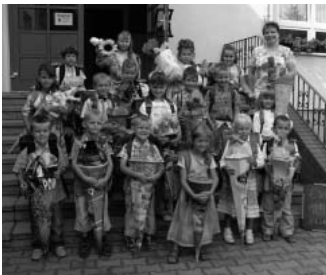
Einschulung in der Kleinen Grundschule Blumenthal

Wir wünschen den Erstklässlern einen guten Start ins Schulleben und viel Spaß sowie Freude am Lernen.