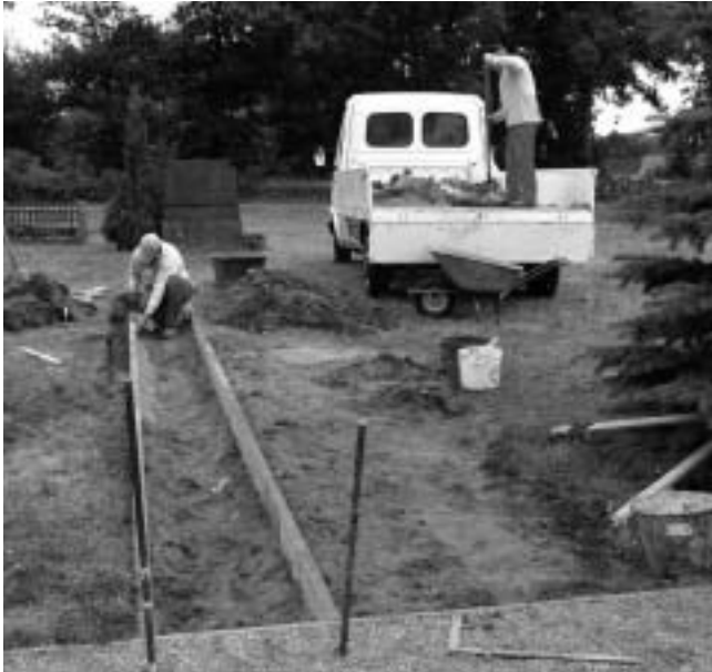
Arbeiten an den Urnenreihengräbern

Mit den Arbeiten für die anonyme (Friedhof Dahlhausen) und den zwei halbanonymen (Friedhof Dahlhausen und Friedhof Blesendorf) Gemeinschaftsanlagen wird Anfang September begonnen.