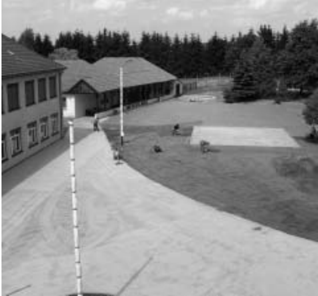
Schulhof der Ganztagschule Heiligengrabe

Der pfützenreiche und schlammige Schulhof gehört der Vergangenheit an. Dieser wurde komplett neu gepflastert und erstrahlt in einer neuen Optik.