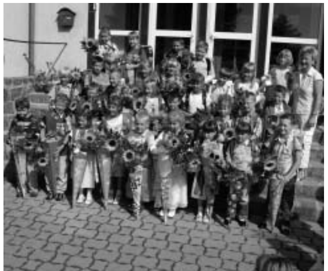
Einschulung in der Ganztagschule Heiligengrabe