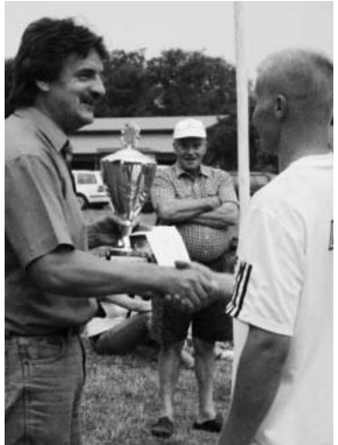
Siegerehrung – Überreichung des Bürgermeisterpokals an die Mannschaft Blumenthal/Grabow