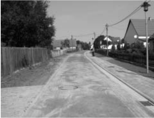
Sanierte Dorfstraße und Wiesenweg

zur Verschönerung des Dorfbildes und zur wesentlichen Verbesserung der Wohnqualität im Ortsteil Grabow bei.