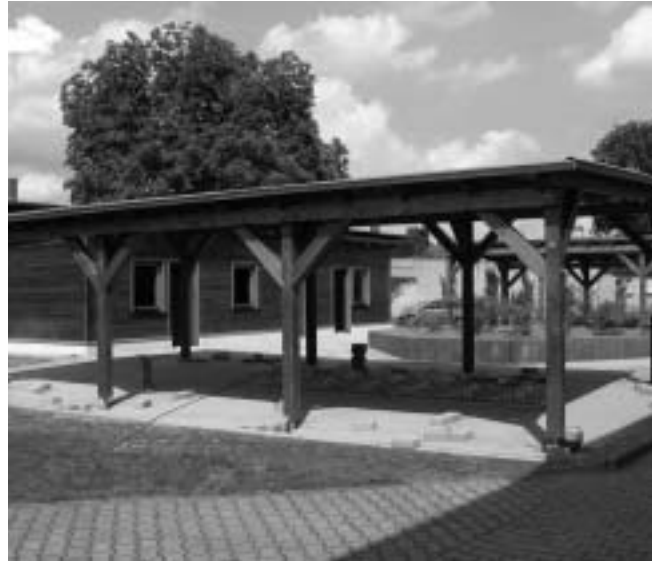
Überdachte Fahrradständer auf dem Schulgelände der Kleinen Grundschule

Mit der Turnhalle der Schule geht es in des Herbstferien weiter. Dort wird der Fußboden erneuert und die Turnhalle erhält einen neuen Farbanstrich.