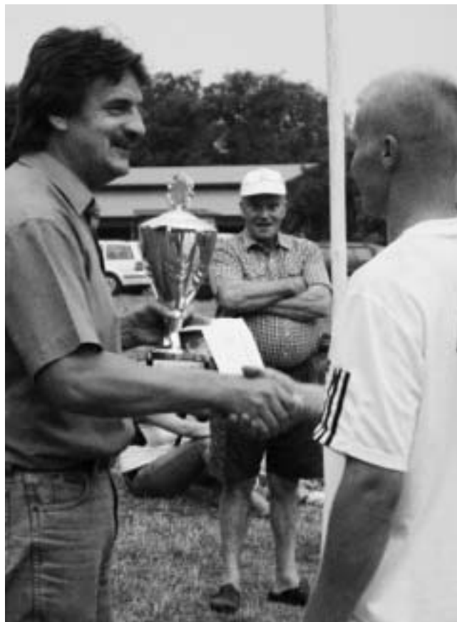
Siegerehrung – Überreichung des Bürgermeisterpokals an die Mannschaft Blumenthal/Grabow