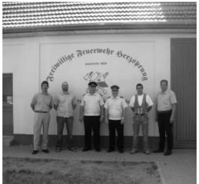
Feuerwehrgerätehaus in Herzprung erstrahlt im neuen Glanz.

Die Maßnahme wurde aus dem Haushalt der Gemeinde mit 57.000 Euro finanziert.