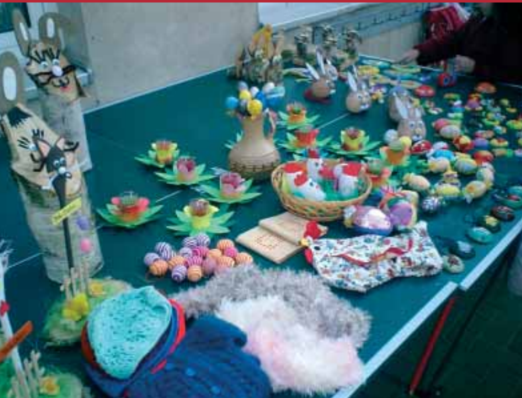
Bürgermeisterwahl • 4. Holzkunsttage • Osterbastelein