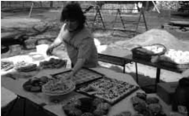
Kaffee und Kuchen beim Osterbasar

Am Mittwoch, dem 28.03.2007, fand in unserer KITA ein Osterbasar statt.