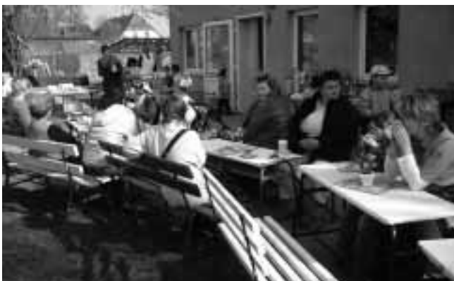
Gäste im Haus der kleinen Strolche

So ganz nebenbei fielen dann auch die Blicke auf den Tisch mit den vielen bunten Basteleien. Vom Osterhasen aus Holz bis hin zu kleinen selbstbehälten Ostereiern war natürlich fast alles „Österliches“ dabei.