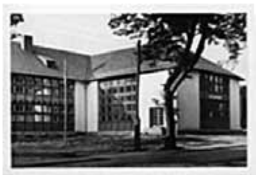
Foto – aus den 50er Jahren